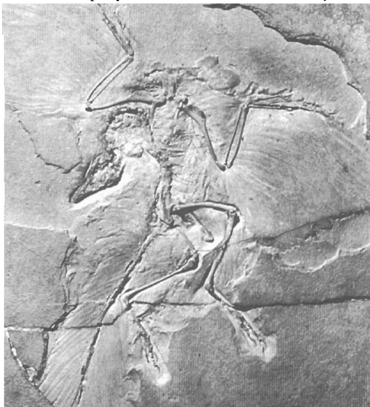
Fig. 1. Archaeopteryx (ejemplar de Berlín, descubierto en 1876)

Durante más de un siglo, nuestros conocimientos sobre los pájaros fósiles del Mesozoico nacieron a partir de los descubrimientos del Archaeopteryx del Jurásico Superior, y de dos pájaros del Cretácico superior parecidos a los pájaros modernos. El Archaeopteryx era único en su notoriedad y en su papel de pájaro reptil o reptil